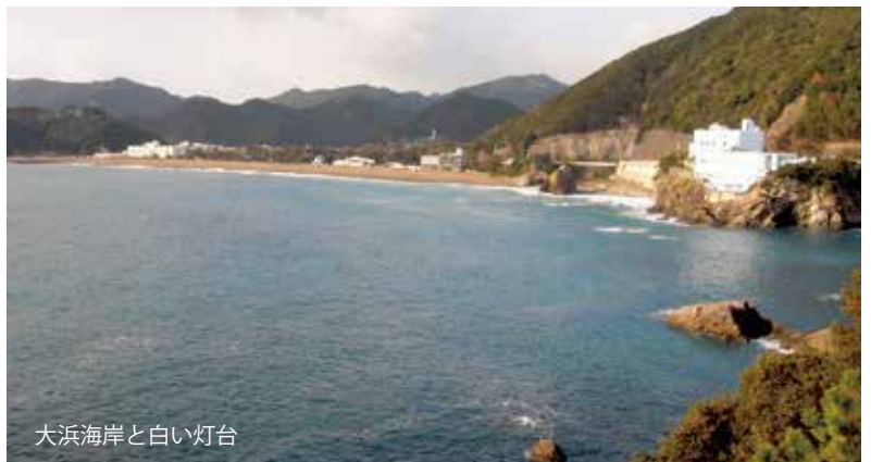
大浜海岸と白い灯台