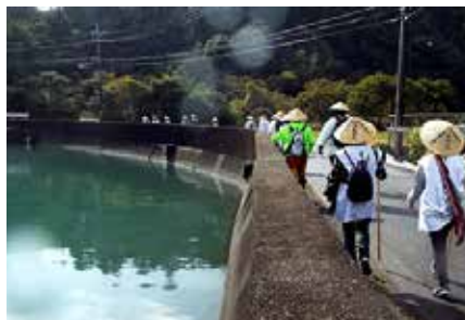
二十三番札所 薬王寺